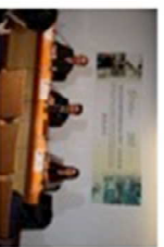
旅遊學院公布研究結果。

研究於2013和2014年內，在50多日內包括節日及假日，街訪逾6千名居民和旅客而成。